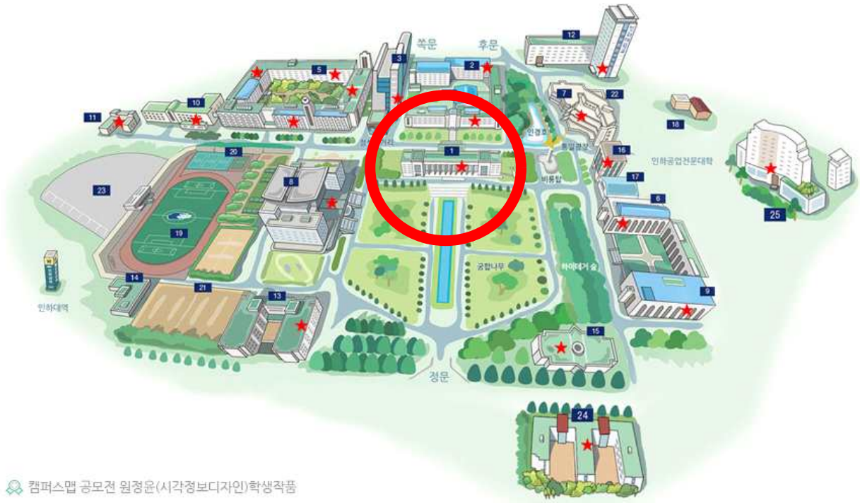
캠퍼스맵 공모전 원정운(시각정보디자인)학생작품